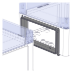
140000250 Polyester Verbindungsflansch