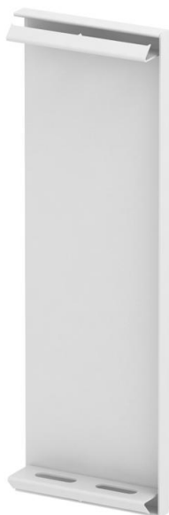
Endstück für GS Geräteeinbaukanal.