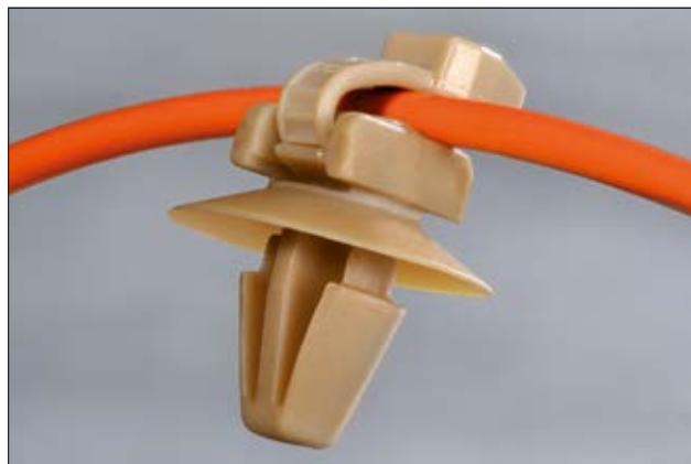
Die PEEK-Befestigungsbinder sind für Bündelgüter ab 1,0 mm geeignet.