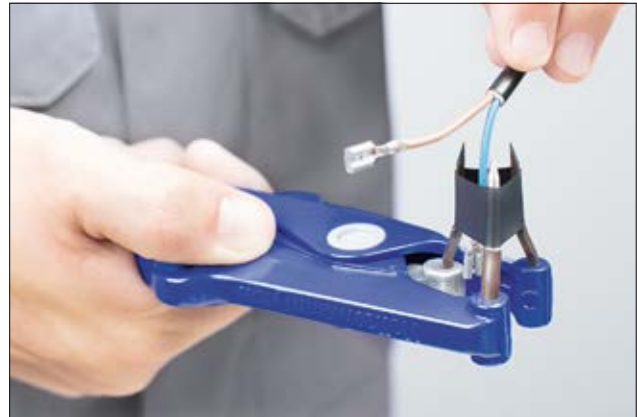
Einfache und sichere Montage von Tüllen und Schläuchen durch die Dreidornzangen K, S und SS.