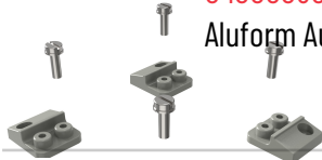
040000800 Aluform Außenbefestigungssteg 80