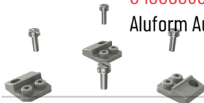
040000800 Aluform Außenbefestigungssteg 80