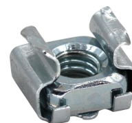
Abb. 3: Automatische Erdung des Deckels über Erdungskäfigmutter