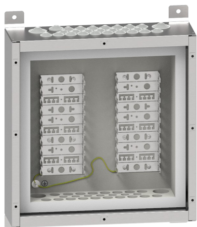
Abb. 1: Brandschutzgehäuse BSG30D mit Montagewanne BR2

Das Gehäuse bietet einen besonders sicheren Betrieb und optimaler Schutz des Gehäuseinneren vor Staub und Feuchtigkeit durch integrierte Stufennippel (Abb. 2) mit Dichtlippen mit Schutzart IP 55 an den Kabeleinführungen.