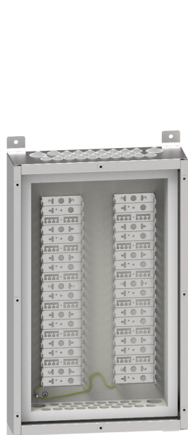
Abb. 1: Brandschutzgehäuse BSG30E mit Montagewanne BR2

Das Gehäuse bietet einen besonders sicheren Betrieb und optimaler Schutz des Gehäuseinneren vor Staub und Feuchtigkeit durch integrierte Stufennippel (Abb. 2) mit Dichtlippen mit Schutzart IP 55 an den Kabeleinführungen.