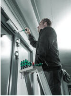
Kraftform Ball-Grip für hohe Drehmomente