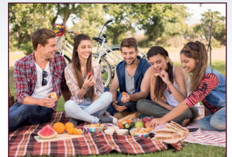
Mobiler Einsatz z. B. im Park, auf dem Balkon oder beim Camping