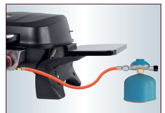
Auch für den Betrieb mit Camping-Gaskartuschen geeignet – zusätzlicher Druckminderer nötig (nicht im Lieferumfang enthalten)